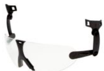
Transparente Ref.: 40139