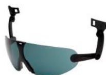
Fumada Ref.: 40141