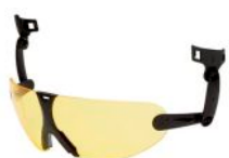
Ambar Ref.: 40140